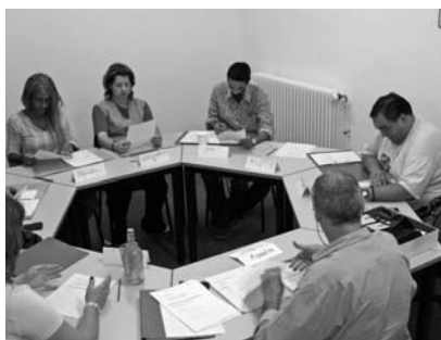
L'atelier de raisonnement logique, une des formations de base

Parallèlement, émergent des besoins en services informatiques (installation, dépannage) qui pourraient constituer une nouvelle activité. Mais cela implique de disposer de compétences larges chez nos stagiaires, et la mise en place d'une organisation ad hoc. Une vision précise de l'avenir de ce secteur est à construire en 2007.