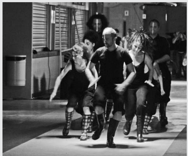
Un groupe de danseurs en répétition