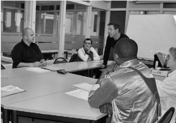
Au cours de méthodes de recherche d'emploi

pas à maintenir mon intérêt. Bien que mon poste se développe et s'enrichisse, j'ai déjà la tête ailleurs. A mon retour de vacances, je me sens un peu perdu: je n'ai plus envie de rester au stock, sans oser en parler, de peur d'être de nouveau sans emploi.