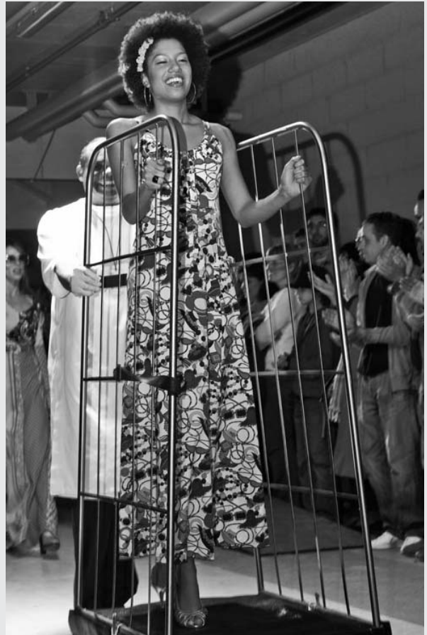
Un défilé original