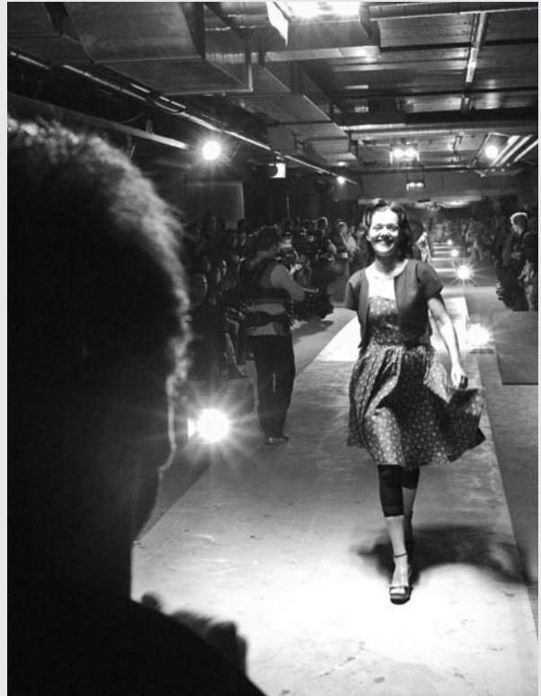
Défilé vintage au cours de la soirée

Au sein du défilé, Réalise proposait un thème dédié aux vêtements de travail. Le passage de personnes en tenue d'ouvrier, de peintre ou de contremaître sur les 80 mètres de podium enthousiasma le public. Les mannequins, tous amateurs, étaient pour la plupart des collaborateurs et stagiaires de Réalise. Par cette symbolique, nous rendons hommage aux travailleurs de l'ombre, l'envers du décor.