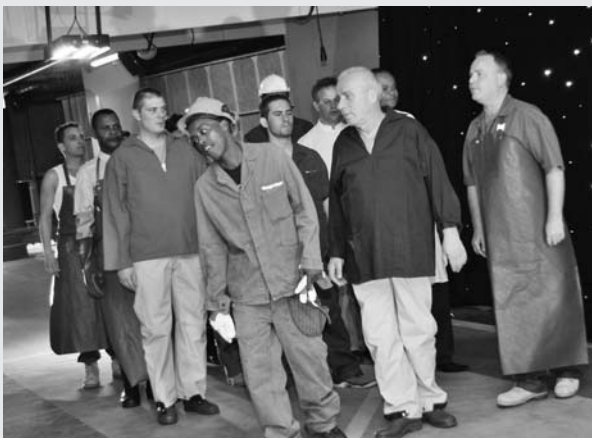
Répétition du défilé «vêtements de travail»

chantier. Nous avons plusieurs fois craint de ne pouvoir tenir les délais. La coopération entre tous les collaborateurs et les stagiaires a été exemplaire, et l'élan de solidarité immense; beaucoup se sont investis sans limites, dépassant les horaires habituels. Cette effervescence créa de précieux échanges de savoir entre différents corps de métier, développa la capacité d'improvisation pour pallier à des problèmes techniques de dernière minute, nous permettant finalement de remplir notre mission