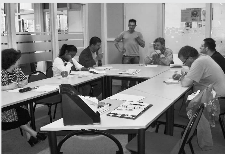
Les cours de français comptent deux niveaux

La Suisse compte 20% de personnes illettrées, parmi lesquels une forte proportion d'étrangers mais aussi de nombreux suisses. Or le manque de maîtrise de la langue ne permet pas de se faire comprendre dans la vie courante, a fortiori dans des démarches plus cruciales. Quand cette situation perdure, elle ne laisse guère d'espoir d'insertion et de promotion.