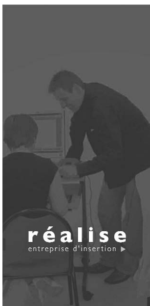
Le nouveau dépliant commercial

Dans le même temps, un nouveau dépliant présentant les prestations commerciales de Réalise a été créé.