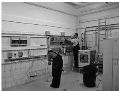
Les travaux d'installation du futur atelier de traitement du linge au printemps 2007

L'atelier maintenance et nettoyage reste largement en deçà de son potentiel économique, faute de pouvoir y allouer des ressources en encadrement suffisantes.