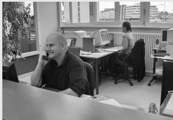
La réception: la carte de visite de Réalise

Le 16 juillet 2006 je quitte Réalise, à la fois triste et soulagé. J'ai repris confiance en moi, ma vie sociale est plus riche, et je sais que quelque chose se dessine pour moi.