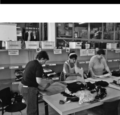
Tri de vêtements de seconde main