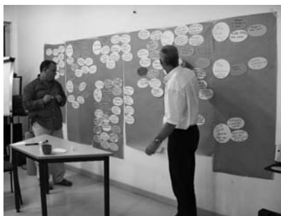
Réunion semestrielle des cadres et de la direction

Le rapprochement de Réalise avec les employeurs, notamment à travers Praille Insertion, influencera aussi à l'avenir notre organisation et nos activités de production. En outre, la formation constitue également un facteur d'influence de notre stratégie. La reconnaissance des formations internes à Réalise, l'avenir de la validation des acquis de l'expérience, les nouvelles réflexions autour de formations courtes en relation avec les opportunités du marché de l'emploi et les futurs employeurs, vont influencer nos activités de manière très concrète.