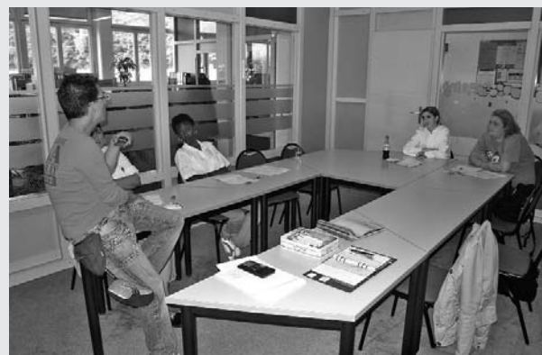
La disposition de la salle favorise les échanges

Ce matériel est utilisé dans des activités de compréhension en mettant l'accent sur le vocabulaire, dans la recherche du sens. Ici la question du contexte doit apparaître au tout premier plan, car l'objectif essentiel d'une activité de compréhension est de travailler sur le contenu et non sur des mots ou phrases isolés. Les mots possèdent, en plus de