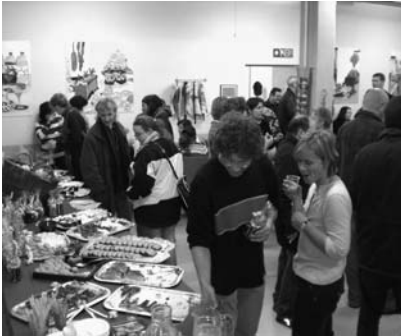
Collaborateurs et stagiaires réunis lors du goûter de fin d'année

En outre, l'émission «Mise au point» du 28 mai consacrée à la difficulté de retrouver un emploi, était en grande partie illustré par un reportage au sein de Réalise.