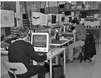
L'atelier de recyclage de matériel informatique