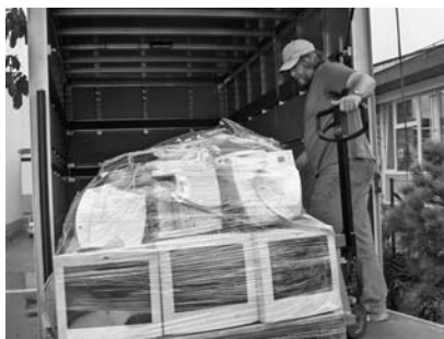
Récupération de matériel informatique en entreprise