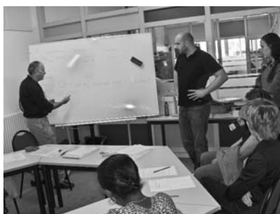
Démonstration d'un atelier de raisonnement logique lors des journées portes ouvertes