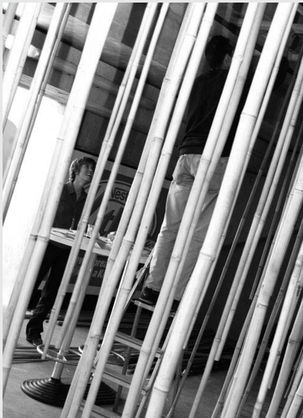
Installation d'une forêt de bambous suspendus