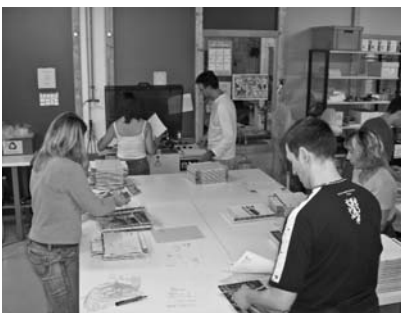
Mise sous film d'un magazine

Réalise a notamment fourni 200 ordinateurs à l'Observatoire technologique du canton de Genève pour le projet Cyber Edu destiné à équiper une douzaine de cyber espaces au Mali.