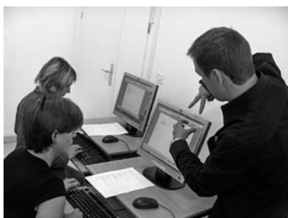
Un cours d'initiation à l'informatique

Au cours de l'année 2006, les stagiaires de Réalise ont suivi un total de 26 346 heures de formation en interne, soit une moyenne de 119 heures de formation au cours d'un stage.