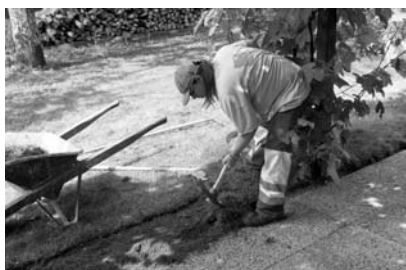
Entretien d'espaces verts

Le chiffre d'affaires de l'atelier jardinage atteint CHF 220 500.–, une croissance de près de CHF 80 000.– par rapport à 2005. Cette belle progression est due à deux principaux facteurs: le réajustement du prix de certaines prestations et l'obtention de nouveaux mandats. L'atelier rationalise peu à peu sa gestion, en renonçant aux petits mandats peu rentables pour des raisons de logistique et d'organisation.