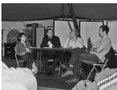
Alain Girardin participant à un débat à la Cité des métiers