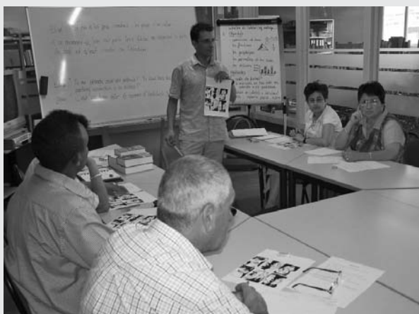
Différents outils permettent une mise en situation

L'objectif est d'aider les stagiaires à réemployer les structures et le lexique déjà acquis en développant leur imagination et leur créativité. Il convient de développer entre les stagiaires des dialogues en contexte, et ce dès le début de l'apprentissage. L'organisation spatiale dans la salle de formation doit permettre aussi de tels échanges: disposition des tables en U, afin que les stagiaires puissent se faire face, aménagement d'un petit espace libre, espace scénique, destiné aux simulations. Le formateur a alors un rôle d'animateur, absent de la conversation, mais vigilant face aux problèmes linguistiques et communicatifs des stagiaires auxquels il remédie ultérieurement.