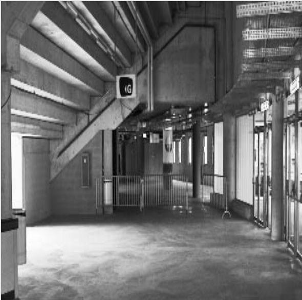
Un aperçu de la coursive avant transformation