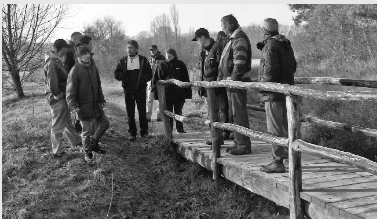
Un pont construit et entretenu par l'équipe environnement

L'atelier jardinage et environnement a été créé en 1993 au sein de Communauté Service, le programme d'emploi temporaire fédéral de Réalise. A l'époque, la loi sur l'assurance chômage autorisait uniquement des activités n'entrant pas en concurrence avec les entreprises privées. L'ensemble des ateliers de Communauté Service travaillait ainsi pour des communes, des services publics ou le secteur associatif.