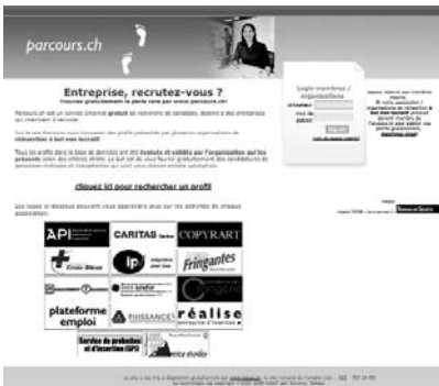
Le site Internet www.parcours.ch

Ce sont d'ailleurs des aspects qui ressortent très nettement des recommandations faites dans la publication liée à ce projet MAPA (Regards croisés sur l'éducation non formelle: analyses de pratiques et recommandations – ISBN 978-972-8743-20-3 – DCU 371).