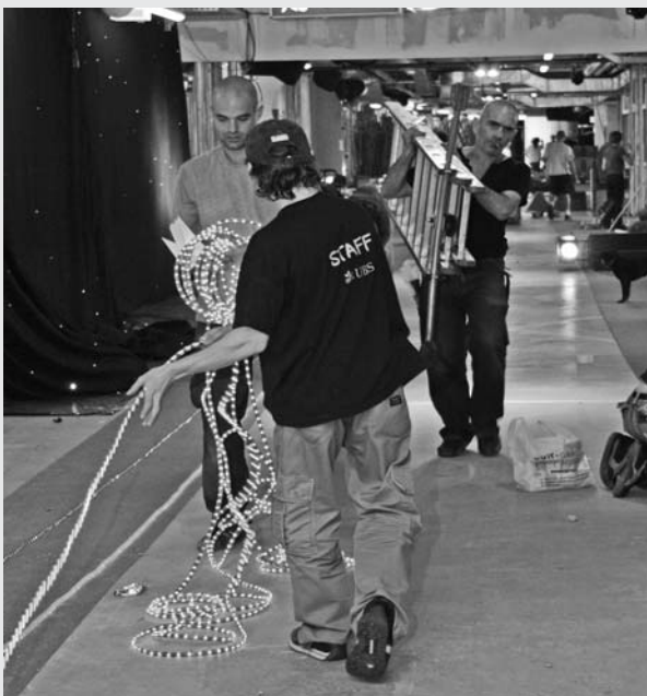
Le chantier à la veille du défilé

chantier. Nous avons plusieurs fois craint de ne pouvoir tenir les délais. La coopération entre tous les collaborateurs et les stagiaires a été exemplaire, et l'élan de solidarité immense; beaucoup se sont investis sans limites, dépassant les horaires habituels. Cette effervescence créa de précieux échanges de savoir entre différents corps de métier, développa la capacité d'improvisation pour pallier à des problèmes techniques de dernière minute, nous permettant finalement de remplir notre mission