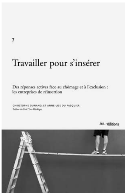
Couverture du livre co-écrit par Christophe Dunand

Bien que les premières entreprises d'insertion soient nées il y a plus de vingt ans, les publications sur ce champ d'activité novateur sont encore rares. Ces entreprises, aussi nombreuses en Suisse que par exemple en France, en Belgique ou en Italie, ont fait la preuve de leur utilité dans la lutte contre le chômage et l'exclusion; toutefois leur consolidation et leur intégration à l'avenir dans les politiques publiques impliquent encore un important travail de capitalisation et de modélisation. C'est ainsi l'objectif de cet ouvrage qui, s'il se base largement sur les expériences menées à Réalise, porte son accent plus globalement sur les entreprises d'insertion et sur l'insertion par l'économique comme stratégie d'intervention.