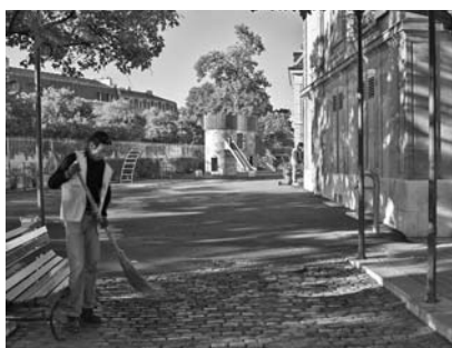
Entretien des places de jeux

L'atelier maintenance, nettoyage et voirie a légèrement dépassé le chiffre d'affaires prévisionnel pour atteindre CHF 419 300.–, dont CHF 313 000.– pour l'entretien des places de jeux de la Ville de Genève. Fin 2005, le Conseil municipal avait annoncé une importante diminution de ce mandat qui n'a été que partiellement compensée. Avec moins de temps pour la même surface à entretenir, les conditions de travail sont devenues plus difficiles et la propreté des places de jeux se dégrade. Un complément de budget a permis de remédier partiellement à ces problèmes en cours d'année. L'organisation de ce mandat a fait l'objet d'importantes négociations encore inachevées en fin d'année.