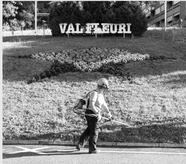
Entretien de l'EMS Val Fleuri

L'entretien de l'EMS Val Fleuri est à cet égard particulièrement intéressant. Tous les petits chantiers ne sont pour autant pas exclus: certains sont particulièrement intéressants, par la nature du travail, mais aussi parce qu'ils sont représentatifs de l'activité quotidienne d'une entreprise de jardinage.