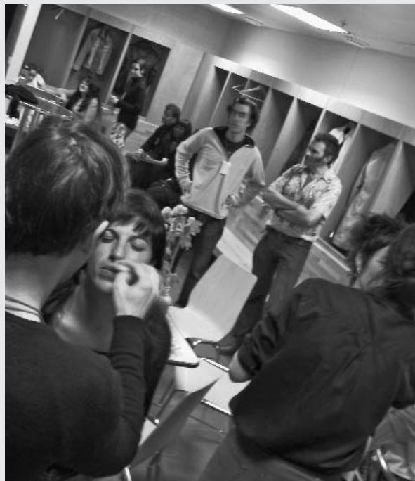
Préparation des mannequins en coulisses

Au cours de la soirée, de nombreux collaborateurs et stagiaires étaient présents à titre bénévole, comme serveurs(ses), habilleurs(ses), mannequins, pour assurer la sécurité, la logistique et le démontage, faisant le bonheur des 3000 visiteurs restés parfois jusqu'à 4 heures du matin dans une frénésie dansante.