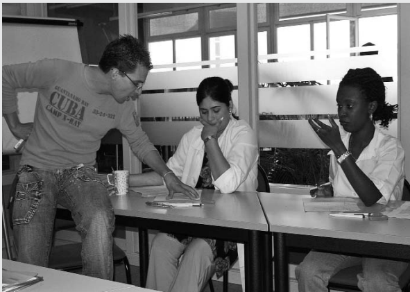
La formation, un point de rencontre

En conclusion, la formation de français s'apparente également à un lieu de vie qui est un espace de paroles, un point de rencontre et qui permet de restaurer les liens sociaux. A travers cette formation, il s'agit d'augmenter les valeurs personnelles et le potentiel professionnel des stagiaires, et de les aider à se stabiliser afin qu'ils puissent durablement s'intégrer dans le monde du travail.