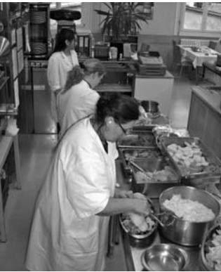
Préparation du plat du jour