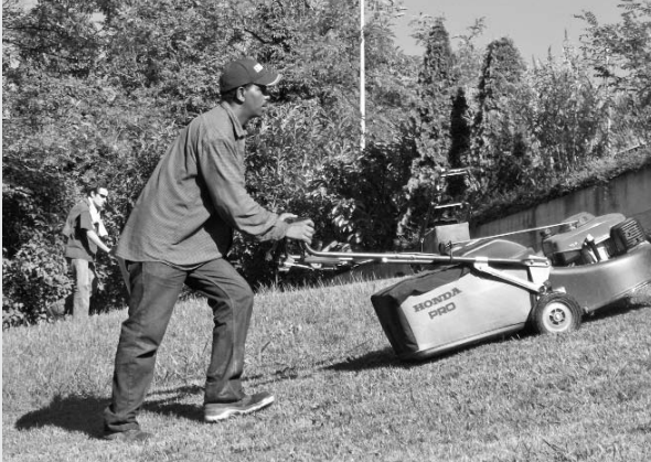
La tonte, une des prestations de l'atelier