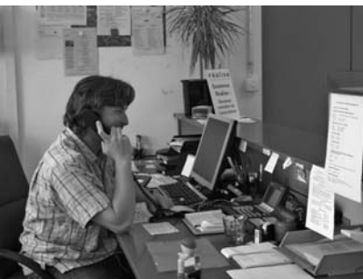
La réception de Réalise