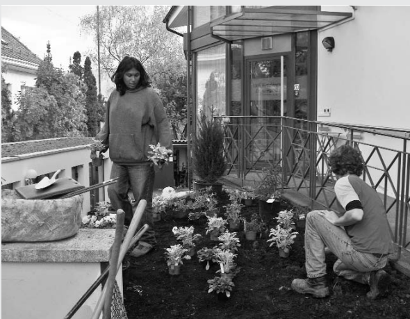
Plantations à l'EMS Beauregard

L'organisation de l'atelier se rapproche de plus en plus de celui d'une entreprise privée de jardinage, avec les contraintes d'une entreprise d'insertion employant du personnel aux problématiques spécifiques. Ainsi, en fonction de leurs compétences initiales en jardinage et de leur situation personnelle, tous les stagiaires ne peuvent travailler de manière autonome sur les chantiers. C'est un des motifs qui poussent l'atelier à rationaliser la production en privilégiant les chantiers importants où un encadrant peut piloter seul deux à trois groupes de stagiaires. Souvent, ce sont aussi des chantiers formateurs grâce à la grande variété de tâches qu'ils proposent.