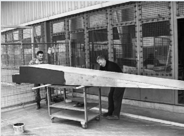
Création d'un podium pour le défilé

L'atelier jardinage créa des podiums pour le défilé, une salle de cinéma, ainsi que les nombreux panneaux décoratifs organisant l'espace et masquant la structure.